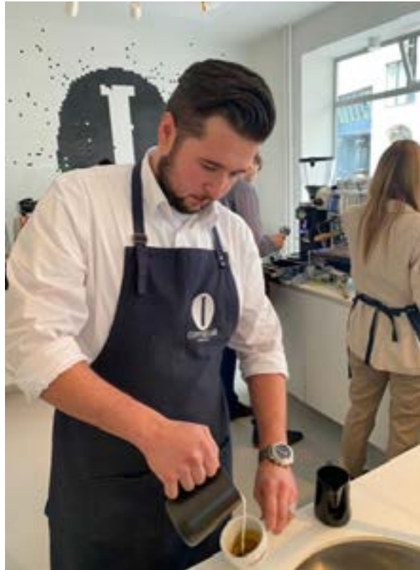
Latte Art Training

Das erste Semester war sehr praxisbezogen. Zuerst hatten wir zwei Wochen lang eine Einführung in den Bereich Service. Danach wurden wir in verschiedene Hotels geschickt, um das Gelernte in der Praxis anzuwenden.