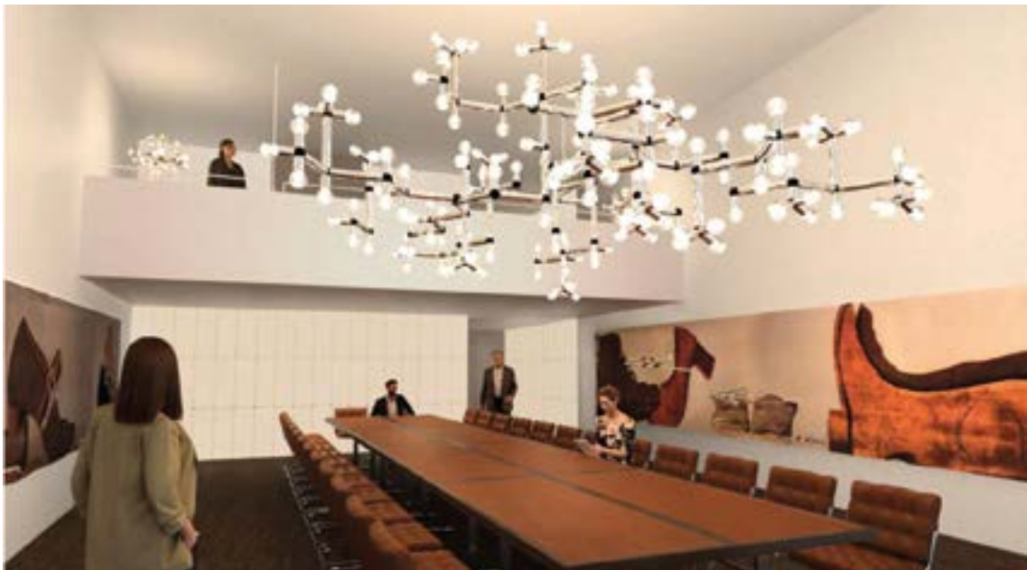
Visualisierung des Architekturbüros Groenlandbasel: 4. Obergeschoss, Zunftsaal