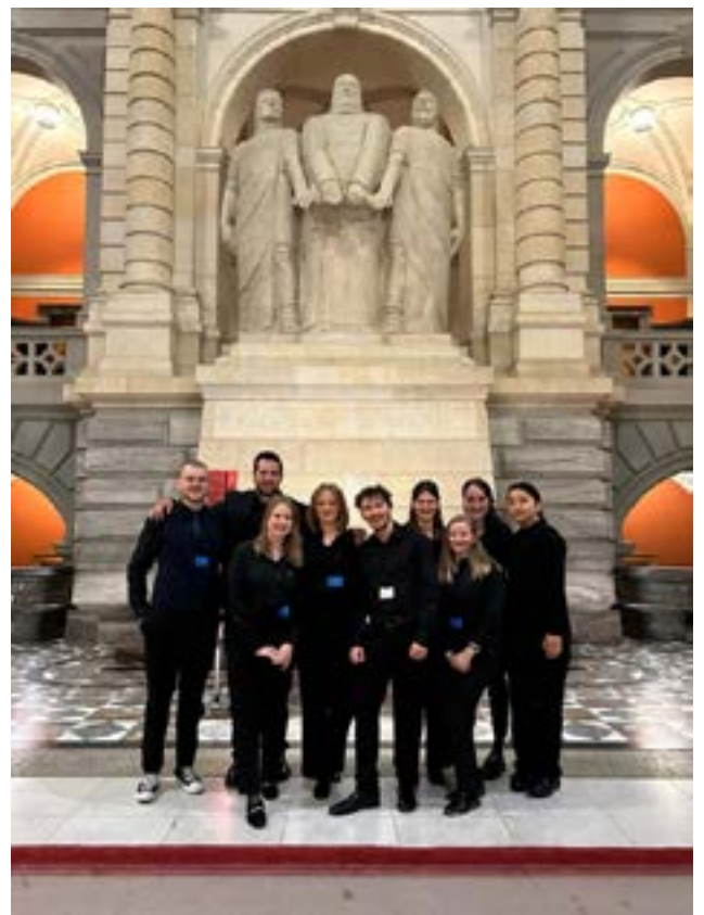
Einsatz bei der Europarat-Konferenz im Bundeshaus

Wie bei jeder Ausbildung war alles mit viel Theorie verbunden, was gleichbedeutend war mit sehr viel Eigendisziplin und Selbststudium. Es war sehr intensiv und der Druck hoch, da wir in den meisten Fächern während des Semesters keine Prüfungen absolvierten. Als wir dann zu