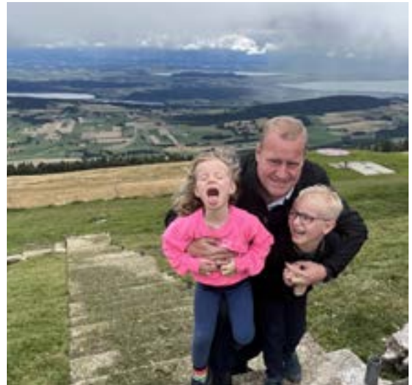
Mit meinen Kindern auf dem Chasseral