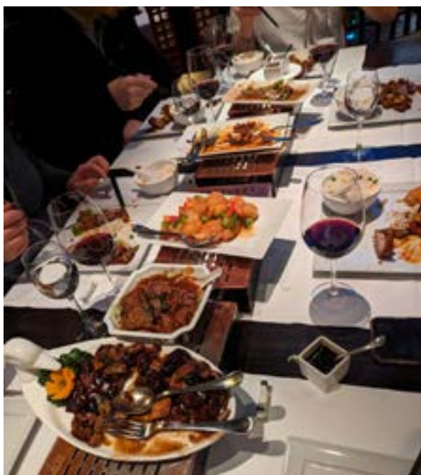
Unser Abendessen im China Garden