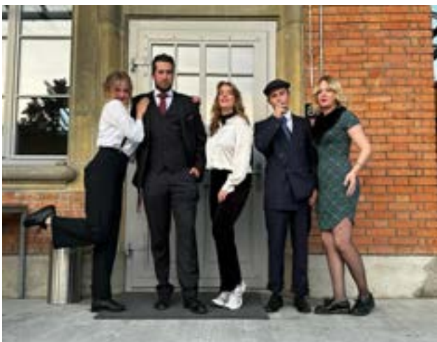
Peaky Blinders Motto-Party

Es war ein intensives Semester mit vielen Gruppenarbeiten, welche wir in Zusammenarbeit mit einem Hotel gemacht haben. Viele verschiedene Aspekte eines Betriebes mussten wir unter die Lupe nehmen und analysieren. So sind die Fächer my Business, Marketing und Buchhaltung ineinander verflochten.