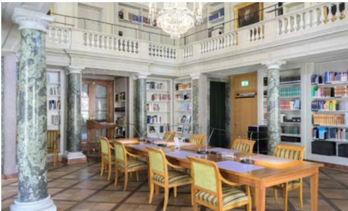
Bildbeschreibung. Der Hallersaal dient als Lesesaal, in dem wertvolle Handschriften und Dokumente vor Ort studiert werden können.

tionen sowie der burgerlichen Zünfte und Gesellschaften. Auch das Gesellschaftsarchiv der Schuhmachern wird im gesicherten Magazin bei einer Luftfeuchtigkeit von 45 Prozent und einer Raumtemperatur von 18 Grad Celsius fachgerecht gelagert. Die älteste Schrift unserer Zunft, ein «Restanzenbüchlein», stammt aus dem Jahr 1489. Weitere Dokumente aus dem 16. Jahrhundert betreffen vor allem die Zunftfinanzen. Sämtliche Bestände sind im Online-Archiv inventarisiert und können – nach einer schriftlichen Bestellung – im Hallersaal gesichtet und gelesen werden. Von Vorteil ist dabei die Kenntnis der deutschen Kurrentschrift (näheres dazu im neuen Zunftbuch: S. 142-145).