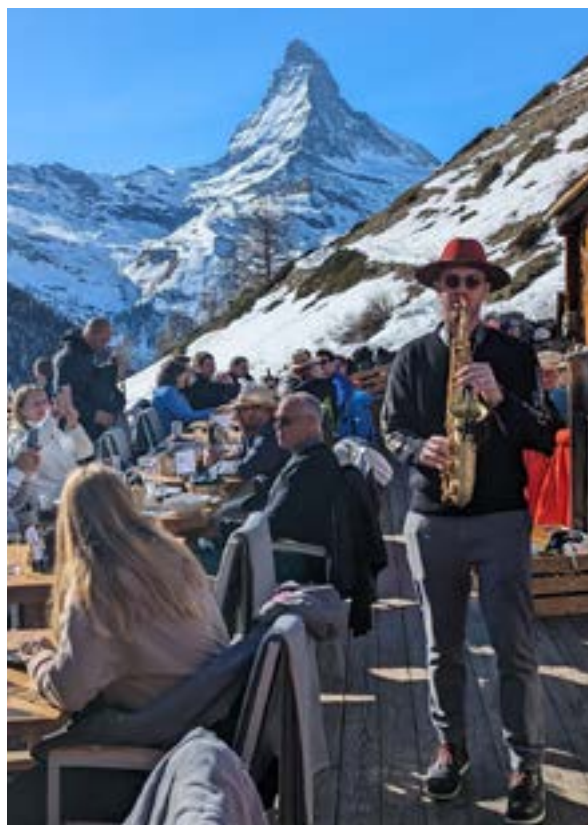
Die musikalische Unterhaltung in der „Adler Hitta“

noch in den Genuss einer Saxophon-Jazz Aufführung, bei der ein Mitglied unserer Gruppe sich selbst als John Coltrane in Szene setzte.