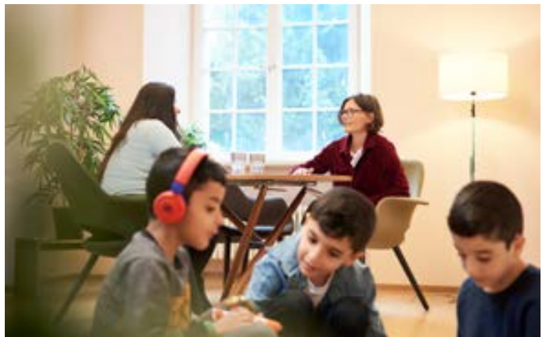
Rechts: Eine ratsuchende Mutter im Gespräch mit einer Familienberaterin. Die Kinder beschäftigen sich derweil selbst.