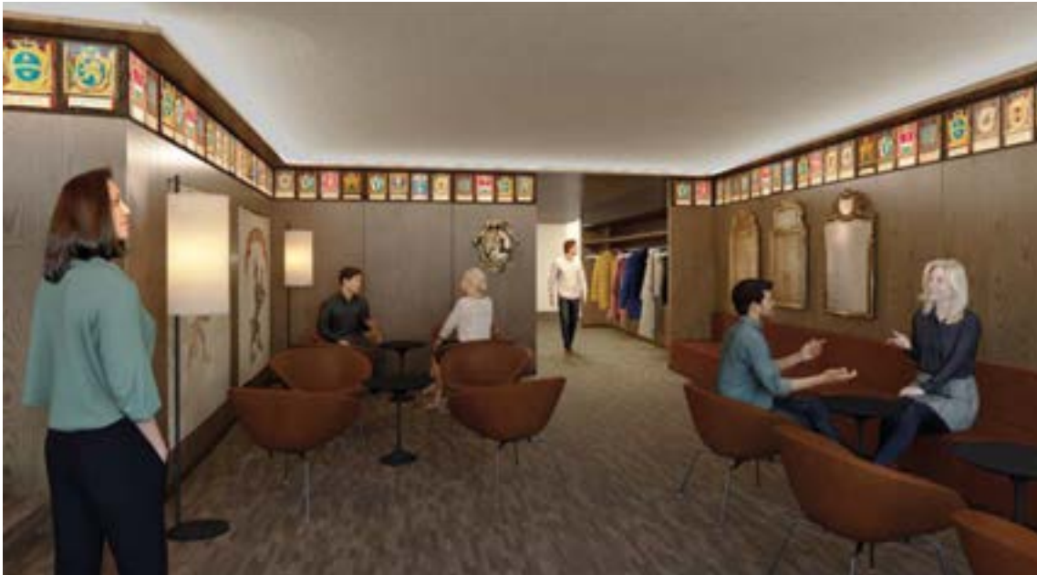
Visualisierung des Architekturbüros Groenlandbasel: 3. Obergeschoss