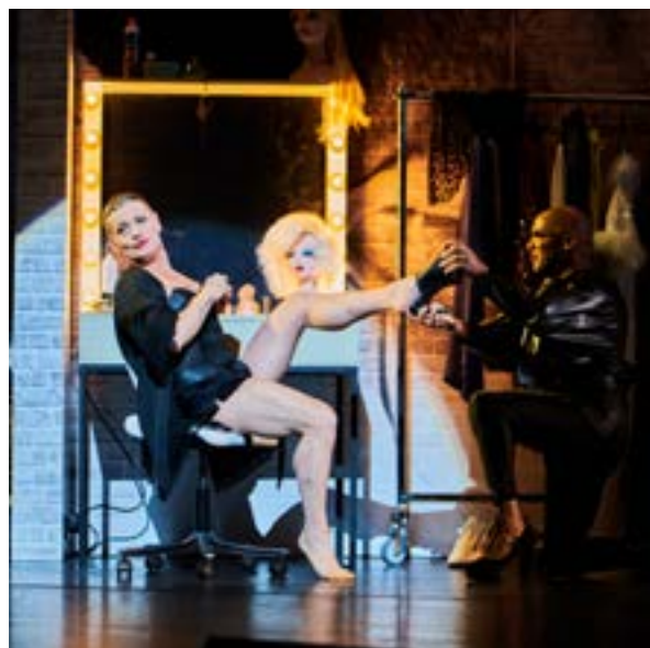
«Zaza» in der Künstlergarderobe des Nachtclubs

Doch die Berner Inszenierung (Regie Axel Ranisch) ist mehr als lustige