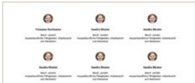
Liste der „öffentlichen“ Profile im geschützten Bereich.