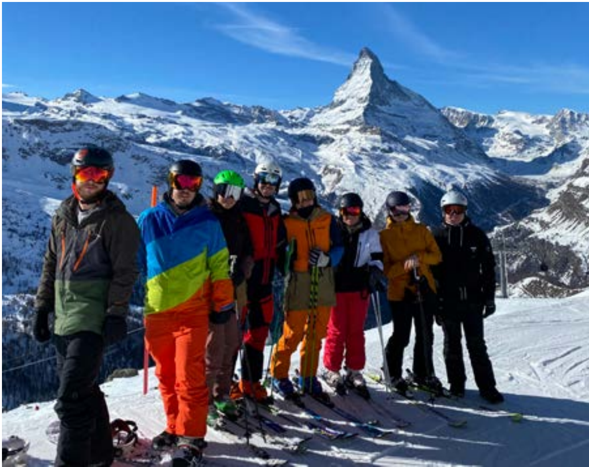
Das schöne Wetter vom Sonntag auf der Seite Sonnegga mit dem bekannten „Horu“

Text/Bilder: Nathalie, Fabienne & Dominik Rahm