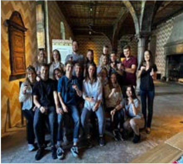
Degustation im Schloss Chillon

den Prüfungen kamen, hiess es «do or die». Ich habe mir dies zu Herzen genommen, denn diese Ausbildung ist mir sehr wichtig. Meine guten Resultate zeigen mir, dass ich auf dem richtigen Weg bin!