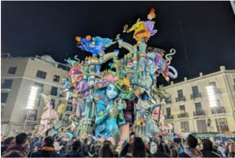
Eine der vielen Skulpturen, die während der Fallas aufgestellt werden.