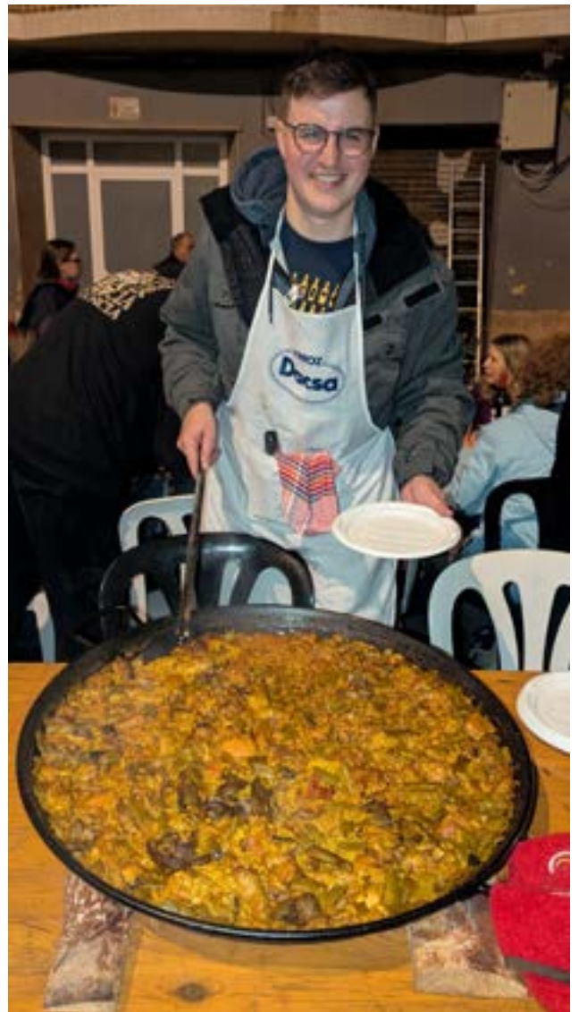
Ich mit meiner valencianischen Paella.