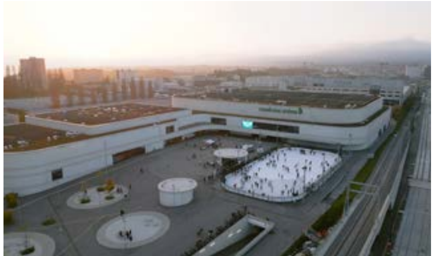
Links: O'Bloc-Halle Ostermundigen, rechts: Vaudoise Aréna, Pully