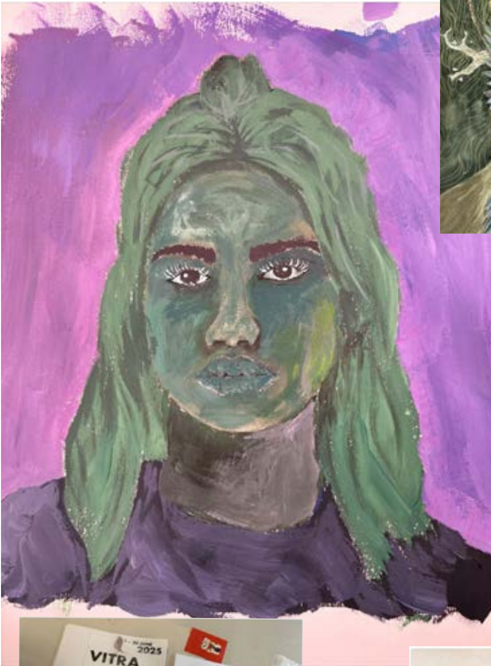
Porträt „wilde Farben“