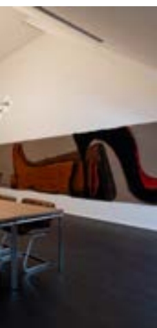
em Glanz, zu verlieren.