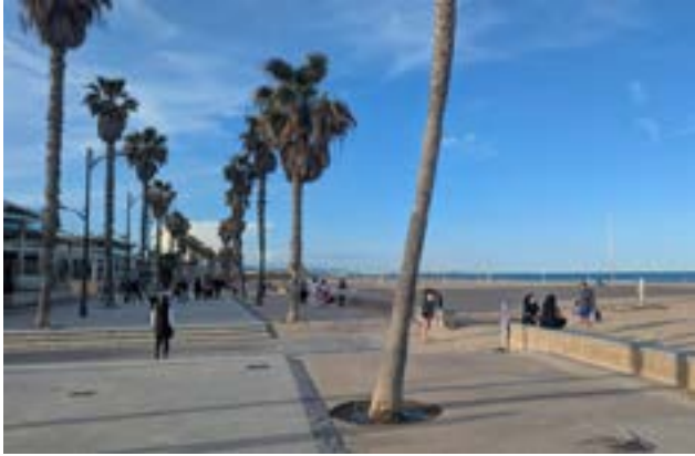
Die Promenade am Mala-Rosa Strand.