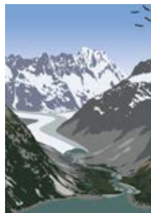
Maturaarbeit von Jael Meyer: eine dreiteilige Posterserie ums Thema Aare, Bilder: Jael Meyer