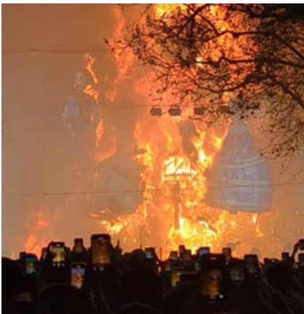
In der letzten Nacht der Fallas Feste werden alle Skulpturen feierlich niedergebrannt.

zug der Fallas, teilgenommen, edel gekleidet als Fallero. Durch meine Falla-Gruppe habe ich auch bei einem Paella-Wettbewerb mitgemacht. Dafür wurden eine Seitenstrasse abgesperrt, Feuerstellen entzündet, und überall sassen Leute auf