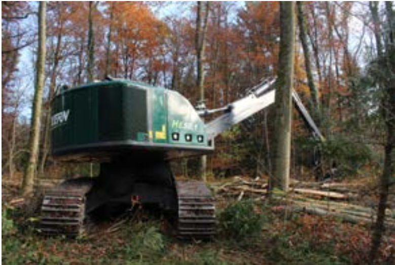
Maschine für boden- und bestandesschonende Holzernte