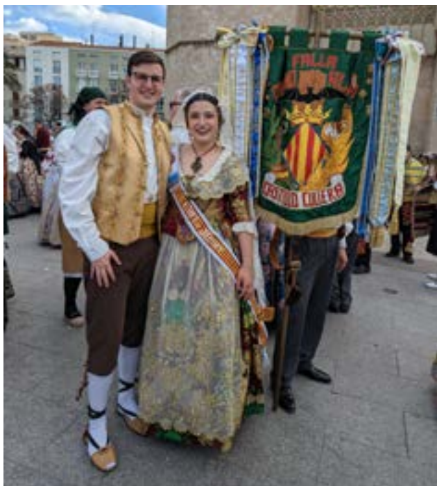
Meine Freundin und ich bei der Ofrenda.

war es nicht so weit her. Die Stellensuche stellte sich glücklicherweise als einfacher heraus, als gedacht: Nach einer Empfehlung kontaktierte mich eine Consultingfirma. Während ich den Unterbruch im Job für eine zweimonatige Reise durch Asien nutzte, absolvierte ich mein letztes Vorstellungsgespräch von Singapur aus. Am Ende hat es geklappt, und nach einem halben Jahr hat sich alles als gute Entscheidung herausgestellt.