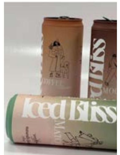
Eigenes Design auf Dosen