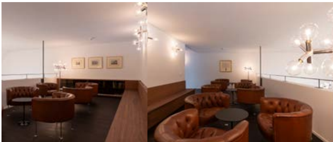
Die Galerie mit dem neuen Sideboard und den alten Stühlen.

Einen Tag später, am 2. Juli, begrüsst wir die Stubenmeisterinnen und Stubenmeister der anderen Zünfte und Gesellschaften bei uns auf der Stube zu einem gemütlichen Austausch. Das Stubenmeistertreffen findet einmal pro Jahr bei einer Gesellschaft statt und im 2025 durften wir Schuhmacher einladen. Die neuen Räume haben auch diese Feuertaufe überstanden und die Rückmeldungen der Gäste waren positiv. Die offizielle Eröffnung fand am 15. Oktober mit über 100 Gästen und einem grosszügigen «Apéro riche» statt (S. 10). Der Ob-