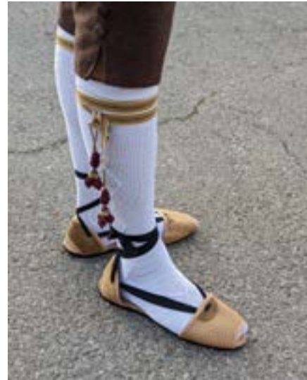
Traditionelles Schuhwerk eines Falleros: Alpargatas valencianas.