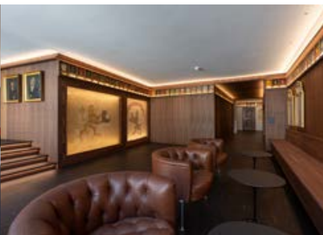
Das neue Wappenzimmer mit den alten Fahnen, den Familienwappen und dem langen Holzbank soll zum Verweilen einladen.