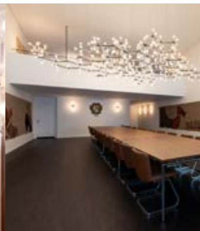
Der Zunftsaal erstrahlt in neuem Glanz, ohne den Stil der 70er-Jahre zu verlieren.