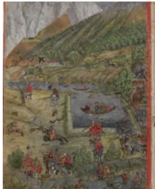
Illustration aus dem Tiroler Fischereibuch (1504).

einem Boot beim Fischen, ein weiteres typisches Motiv seiner Herrscherrepräsentation.