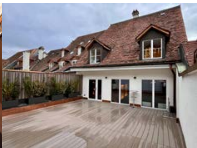
Die neue Dachterrasse erlaubt uns nun auch Apèros draussen zu veranstalten.