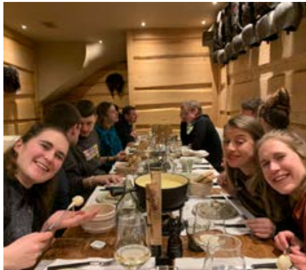
Beim Fondue mit den Mittellöwen

einen oder anderen Glas Weisswein. Um sicherzugehen, dass der Eindruck vom Vorabend nicht getäuscht hatte, wurde das Nachtleben der Region erneut einer gründlichen Prüfung unterzogen und für mehr als gut befunden.