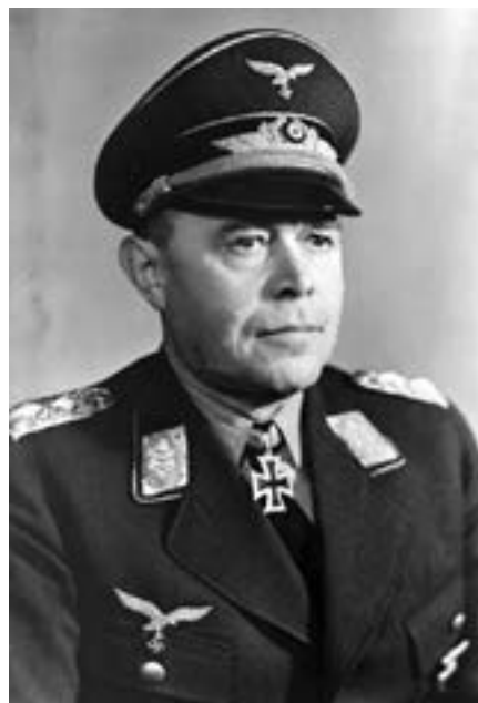
Porträt von Generalfeldmarschall Albert Kesselring.

Am kommenden 8. Mai jährt sich das Ende des Zweiten Weltkriegs zum achtzigsten Mal. Den Geschichtsbüchern zufolge unterzeichnete der deutsche Generaloberst Albert Jodl am 7. Mai 1945 im Hauptquartier der Alliierten in Reims die Kapitulation Deutschlands. Dokumentiert ist auch, dass die Unterschriftenzeremonie in der Nacht auf den 9. Mai 1945 im sowjetischen Hauptquartier in Berlin-Karls horst wiederholt werden musste, da in Reims kein sowjetischer Militärvertreter anwesend war. Weitgehend vergessen ging hingegen, wie es zur Kapitulation kam. Nach dem Zusammenbruch der Südfront, im März 1945, hatte der deutsche Generalfeldmarschall Albert Kesselring,