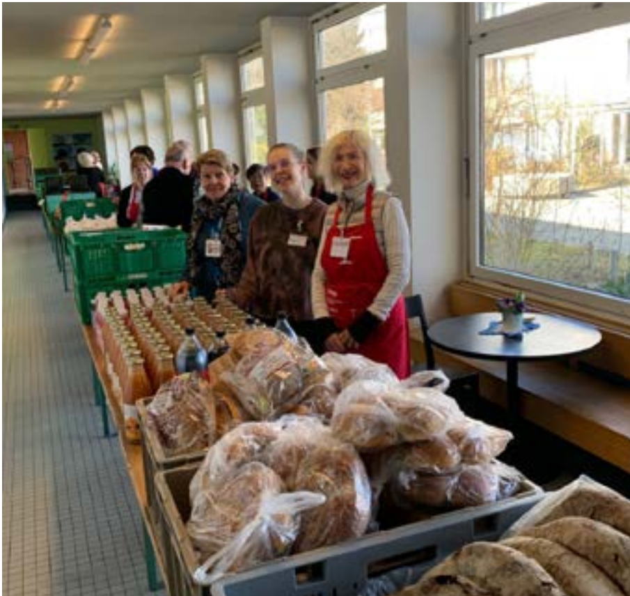
Zusammen mit meinen Kolleginnen bei der Warenausgabe.

Was mir an meiner ehrenamtlichen Aufgabe gefällt: Mit den Menschen in Kontakt kommen, die mir manchmal sagen, wie es ihnen geht, für eine faire Verteilung sorgen und unseren Kunden etwas Feines oder Nützliches mitgeben, das sie sich nicht hätten kaufen können.