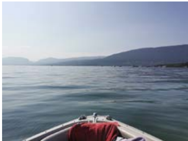
Schöne Sommertage verbringen wir gerne auf dem Neuenburgersee.

Meine Hobbys sind neben Snowboarden, Skifahren, Joggen und rund um Seedorf Biken. Skifahren begeistert die ganze Familie. Jedes Jahr verbringen wir eine Sportwoche mit Skifahren und Boarden in den Bergen.