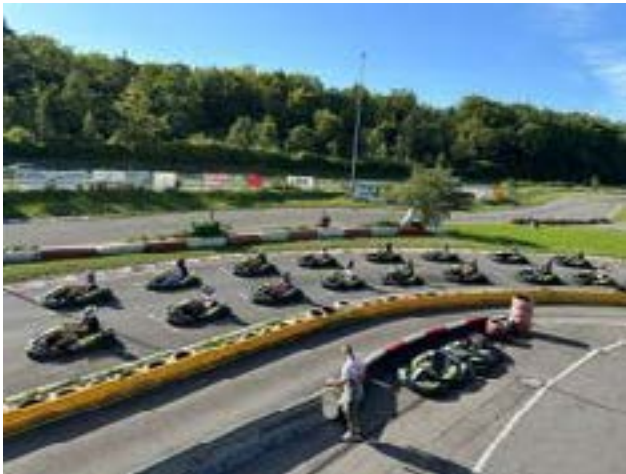
Beim jährlichen Jugendanlass auf der Kartbahn.

darauf, ihren Kunden in persönlichen Gesprächen massgeschneiderte Lösungen zu bieten und hat sich als bevorzugte und verlässliche Bankpartnerin etabliert. Dies zeigt sich in der langjährigen Kundenbindung und dem Vertrauen, das die BEK bei ihren Kundinnen und Kunden genießt.