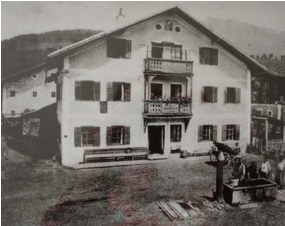
Die Gastwirtschaft «Moserwirt» vor achtzig Jahren.

Wertschätzung für seine Initiative zur Beendigung des Krieges wurde Generalfeldmarschall Kesselring nie zuteil. Ende 1947 verurteilte ihn ein britisches Militärgericht in Italien wegen Kriegsverbrechen zum Tode. Immerhin: Die Todesstrafe wurde in eine lebenslängliche Haftstrafe umgewandelt. Und in den fünfziger Jahren wurde Kesselring sogar begnadigt. Er starb am 16. Juli 1960 in Bad Nauheim.