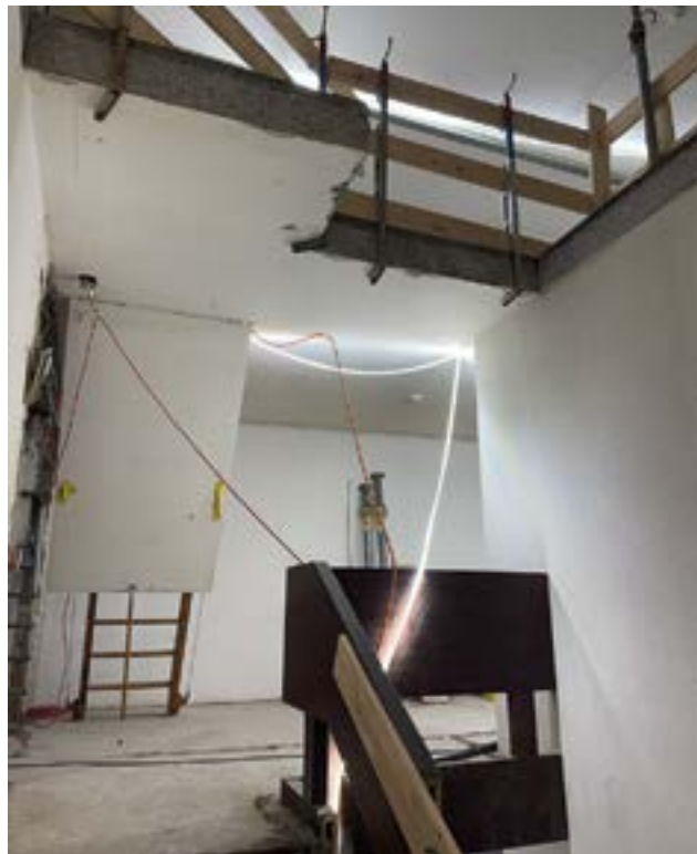
Durchbruch zum Estrich

Im Dezember 2024 begannen die Arbeiten in unseren Gesellschaftsräumlichkeiten. Der Abbruch ging zügig vorwärts und die Einbauten wurden sauber getrennt und entsorgt. Wie bei einem Umbau üblich, gab es aber doch einige Überraschungen, die die Arbeiten verzögerten. In den meisten Räumen wurden Vorsatzwände aus Gips- und Backstein gefunden, welche aus konstruktiven Gründen entfernt werden mussten. Diese Arbeiten dauerten leider länger als geplant, weshalb der Abbruch die anderen Arbeiten verzögerte. Das Positive ist, dass die Räume im 3. Obergeschoss nun grösser werden. Diesen zusätzlichen Platz nehmen wir gerne an! Im Februar wurden die grossen Eingriffe im Beton vorgenommen und die drei Fenster zur zu-