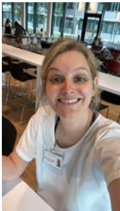
Die 10-Minuten-Pause muss voll ausgekostet werden.

glaubt, dass Anästhesist:innen nur Patient:innen «schlafen legen», täuscht sich gewaltig. Hier geht es um Milligramm-genaue Dosierungen. Denn spielt der Kreislauf einmal nicht mehr mit, entfaltet sich die wahre Kunst der Anästhesie. Innerhalb von Sekunden werden da die physiologischen Verhältnisse des Körpers interpretiert, blitzschnelle Entscheidungen getroffen und der gesamte Organismus mit einem einzigen Handgriff wieder ins Gleichgewicht gebracht. In diesen Momenten zeigt sich, dass Anästhesie weit mehr ist als das sanfte Einschlummern vor einer Operation. Sie ist Hochseilartistik – ein Balanceakt zwischen Bewusstsein und Bewusstlosigkeit, zwischen Schmerzfreiheit und Sicherheit, zwischen medizinischer Wissenschaft und feinsten Intuition. Besonders beeindruckt hat mich dabei die Zusammenarbeit im OP – ein präzise eingespieltes Team, in dem jeder Handgriff sitzt, jede Entscheidung mit ruhiger Bestimmtheit getroffen wird und jede Unachtsamkeit schlicht keinen Platz hat. Doch kein Lehrbuch der Welt hätte mich auf das vorbereiten können, was ich während einer Wachoperation am Gehirn erleben durfte. (Eine