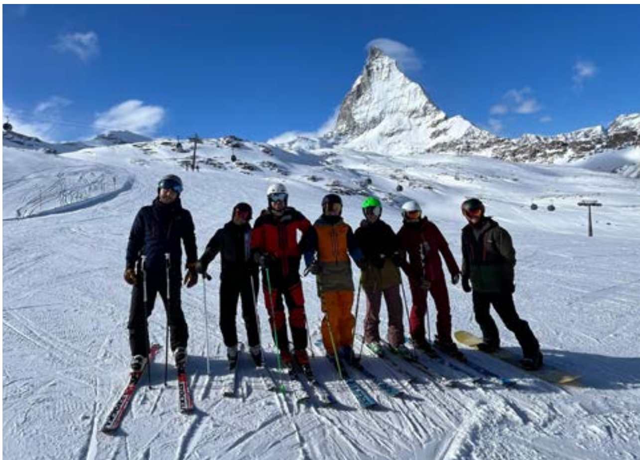
Das legendäre Matterhorn-Foto mit einem Teil der Truppe