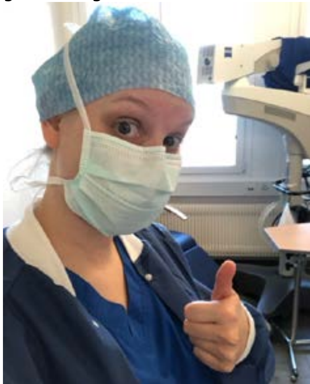
Daumen hoch für die Chirurgie.

Von der feinen Balance der Anästhesie geht es direkt in die Hochgeschwindigkeitswelt der Neurologie-Notfallstation – ein Ort, an dem Sekunden den Unterschied zwischen vollständiger Erholung und bleibender Beeinträchtigung ausmachen. Schlaganfälle, epileptische Anfälle, akute Lähmungserscheinungen – hier ist keine Zeit für Zögern oder langes Abwägen.