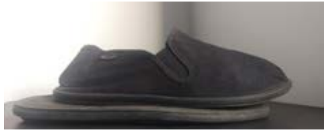
Die kompakten Kung-Fu-Schuhe.

Doch wie komme ich dazu, mir solch exotisch anmutende Schuhe anzuschaffen? Diese Geschichte ist ein anderes Paar Schuhe. Und sie handelt auch von einem: meinen Veloschuhen. Diese waren unverzichtbar auf meiner Reise, hatte ich sie doch als Velotour geplant. Veloschuhe verfügen über spezielle Plattenaufsätze an der Untersohle, die sich in die Pedale ein- und ausklicken lassen. Was äusserst praktisch ist, solange man fest im Sattel sitzt, wird jedoch ziemlich unpraktisch, sobald man wieder festen Boden unter den Füssen hat. Auf diesen Aufsätzen läuft man ziemlich ungeschickt und nie sehr weit. Deshalb war klar, dass ich nebst den Velo- auch noch andere Schuhe benötigen würde. Da ich möglichst wenig