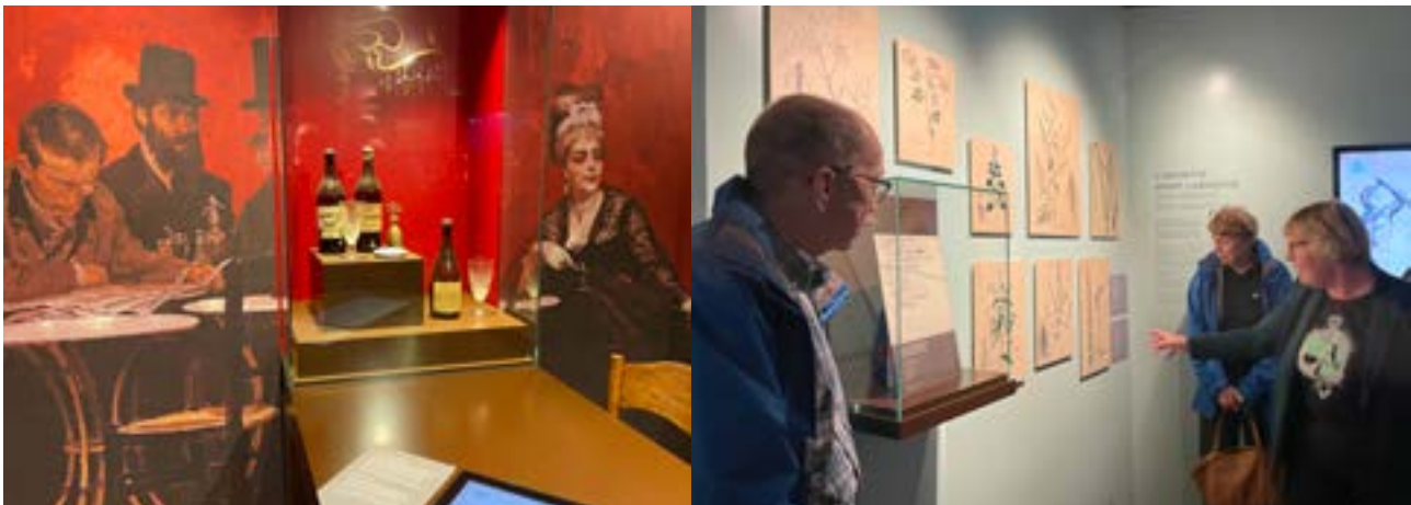
Im Museum „Maison de l'Absinthe“.

Den Tag liessen wir bei einem geselligen Abendessen im Restaurant de l'Aigle in Couvet ausklingen, wo wir uns mit regionalen Spezialitäten verwöhnen liessen. Die Stimmung war ausgelassen und alle Teilnehmenden haben den Ausflug sichtlich genossen. Es war ein bereichernder Tag, der uns nicht nur geschmackliche, sondern auch kulturelle Einblicke in die Welt des Absinthes gewährte.