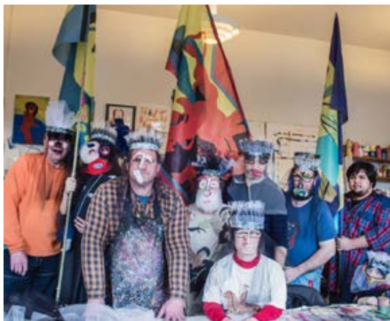
Kollektiv Rohling, courtesy Atelier Rohling.