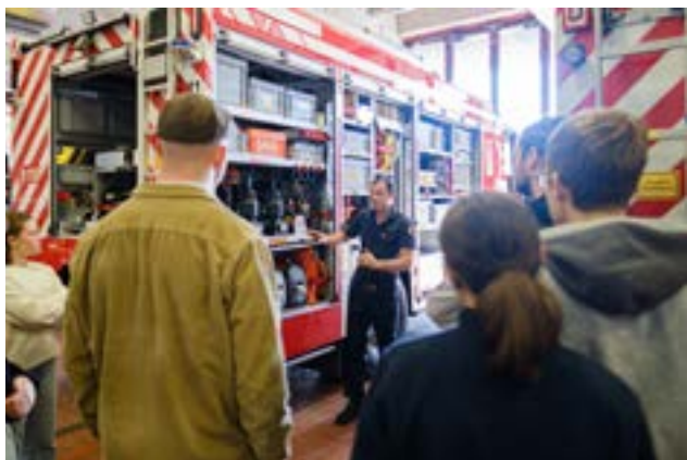
Die Jubu besuchte die Feuerwehr und schaute hinter die Kulissen.

Im Herbst besuchten wir die Feuerwehr von Schutz und Rettung Bern. Wir wurden durch verschiedene Abteilungen der Feuerwehr geführt. Hast du gewusst, dass sie vor Ort unter anderem eine eigene Autowerkstatt und Schreinerei haben? Selbstverständlich wurden uns ausserdem diverse Fahrzeuge vorgestellt.