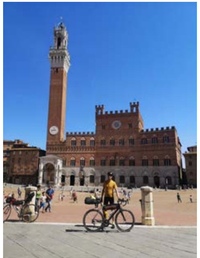
Zwischenhalt in Siena.

lich auf den Sohlen der Kung-Fu-Schuhe unterwegs war. Am ersten Abend in Marseille traf ich in der Bar eines Restaurants einen Sportlehrer an. Als ich von seinem Metier erfuhr, zeigte ich ihm prompt mein Schuhwerk und erkundigte mich danach, für welche Sportart dieses seiner Meinung nach gemacht sei. Ohne gross zu zögern, meinte er: "Kampfsport... Kung-Fu?".