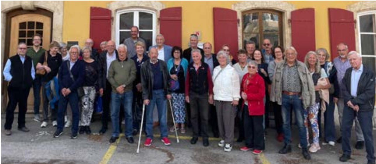
Gruppenfoto vor dem Maison de l'Absinthe.