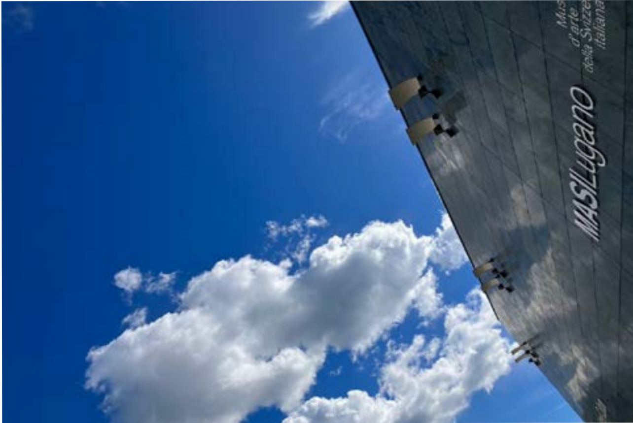
Vor dem MASI Museum in Lugano.