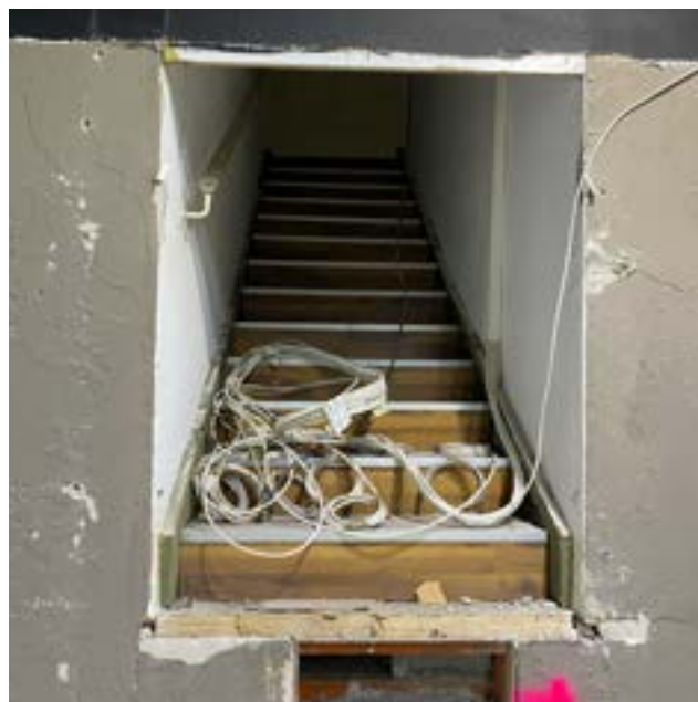
Freigelegte, ehemalige Kellertreppe vom UG in das Erdgeschoss. Wurde um 1980 teilweise abgebrochen und stillgelegt.

frage zur Totalsanierung der Liegenschaft Marktgasse 15 abgegeben werden, inklusive eines Vorschlags zu einem Lifteinbau. Wir erwarten eine Rückmeldung durch die Behörden, insbesondere der Denkmalpflege, auf Anfang 2025. Bei den Sondagen wurden wunderschöne Holzdecken freigelegt und Wandtäfer gefunden. Diese alten Elemente erzählen viel über die Geschichte des Hauses und müssen unbedingt restauriert werden. Mit Hilfe des Planarchives wurden die verschiedenen Umbaustufen (ab dem 19. Jahrhundert!) analysiert, um die Herleitung des Vorschlags der Denkmalpflege darzulegen und die komplexe Situation im Innenhof zu klären. Das Haus beherbergte ursprünglich ein Goldschmiedeatelier mit Werkstatt und wurde später zu einem Stoffgeschäft umgebaut. Die oberen Geschosse, sofern ausgebaut, dienten zuletzt als Büro und Praxisräume. Das ganze Haus hat nur ein komplettes Badezimmer im 2. Geschoss sowie zwei kleine WC im 1. und 3. Stockwerk. Küchen sind im ganzen Gebäude keine vorhanden. Nach der Bereinigung der Voranfrage sollte im 2025 das Baugesuch eingereicht werden. Ein allfälliger Umbau würde frühestens im 2026 erfolgen.