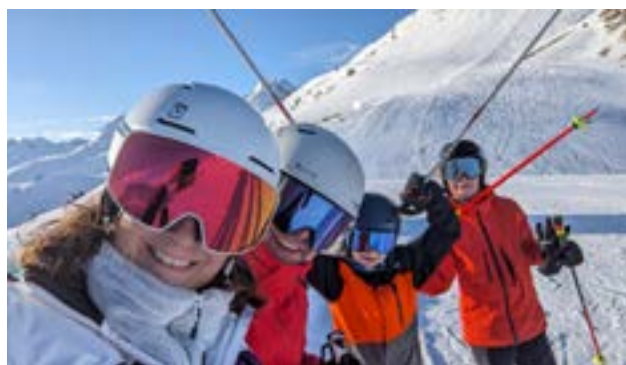
Mit der Familie beim Skifahren in den Bergen.

Ausserdem sind wir als Familie gerne draussen. Am Wasser, am See oder auch am Meer oder in den Bergen. Im Winter fahren wir gerne Ski. Es bleibt uns aber meist nur eine Skiferien-Woche, da die anderen Weekends mit Eishockey gefüllt