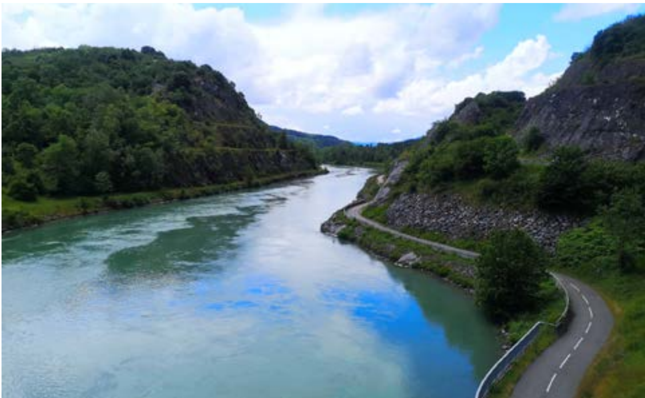
Die Rhone zwischen Genf und Lyon.

Während meiner zweieinhalbwöchigen Reise habe ich zweimal einen platten Reifen geflickt. Meine neuen Lieblingsschuhe aber haben mich nie im Stich gelassen. Sowohl in den Gassen Genuas wie der Metro Marseilles leisteten sie mir treue Dienste. Und seither warten sie zusammen mit mir schon ungeduldig auf das nächste Abenteuer.