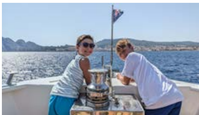
Unsere zwei Kinder bei einem Bootsausflug.

Wie gesagt, sind wir in der Freizeit vor allem von September bis März sehr oft in