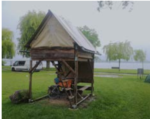
Biwak auf Stelzen am Ufer des Lémans.

Am zweiten Tag nach Marseille begann es erstmals auf der gesamten Reise zu reg-nen. Es sollte glücklicherweise bei diesem einen Regentag bleiben, den ich in Vienne beendete. Der nächste Tag führte mich vorbei an den schönsten mir bekannten Abschnitten der Rhone bis hin zum TCS-Camping im genferischen Vérenaz. Da die Nacht regnerisch war und ich kein Zelt bei mir hatte, schlief ich im vorinstallierten Biwak auf Stelzen. Nach einem heimeligen Migros-Frühstück machte ich mich auf zur