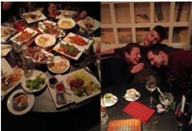
Zünftige Stimmung und kulinarische Vielfalt zum Start ins Wochenende.

das Eis sofort gebrochen. Mein Highlight zum Start war definitiv der Freitagabend: Im China Garden hat jeder Tisch ein vielseitiges Buffet bestellt, sodass von allem etwas dabei war. Und