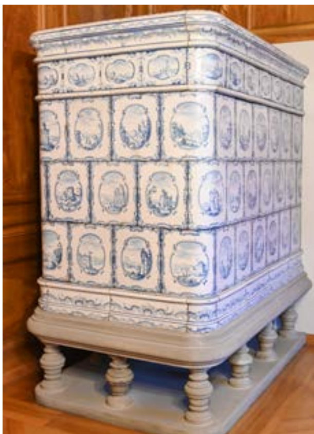
Der Kachelofen im Zunfthaus der Gesellschaft zu Schuhmachern.

Text: Neal Tritten