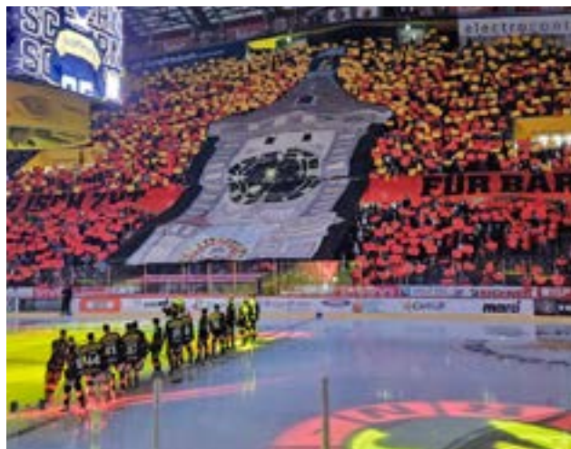
Fan-Stimmung im Eishockeystadion Bern.

Im kommenden September findet das nächste Abenteuer statt. Die Alpen Challenge Lenzerheide, wo es über den Albula-, Maloja- und Splügenpass geht.