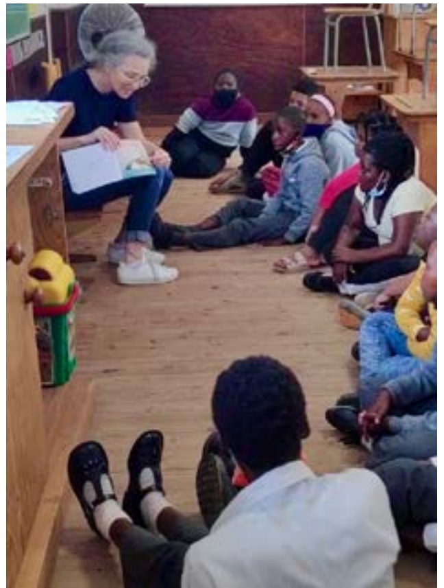
Freiwilligeneinsatz, Vorlesen in der Mittagspause, Heilpädagogische Schule Hermanus, Südafrika.

Heute bin ich an der Hochschule der Künste tätig und für Studierende sowie Dozierende aus dem Fachbereich Gestaltung und Kunst in unterschiedlichen Belangen Ansprechpartnerin, wie auch für weitere Aufgaben zuständig.