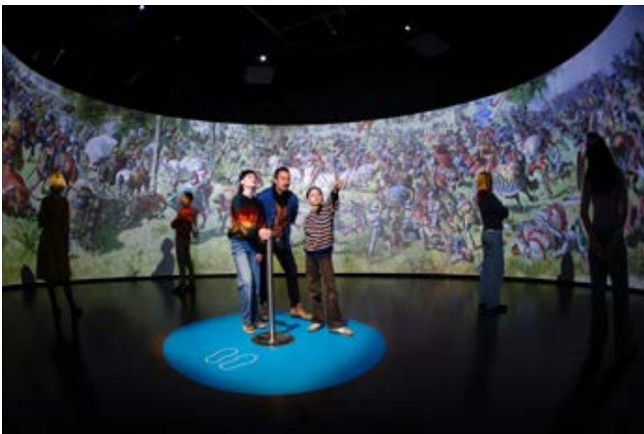
Das digitalisierte Murtenpanorama im BHM.

An der Vernissage im Casino war die Rede von Patriotismus, Nationalismus und Verherrlichung. Angesichts des anhaltenden Ukrainekriegs und am Vorabend eines möglichen Angriffs der USA auf den Iran sind die historischen Interpretationen von Krie-