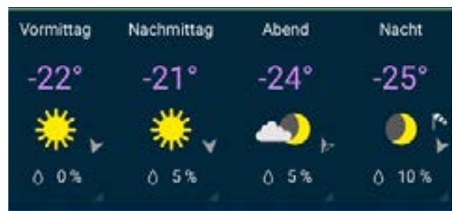
Zermatt zeigt die kalte Schulter: Rekordverdächtige -25 Grad auf dem Display.

Das neue Gesicht: „Uff, ja! Temperaturen von bis zu -20 Grad am Klein Matterhorn und Windböen, die einen fast vom Berg geweht hätten. Dass die meisten Lifte zu waren, war natürlich Pech. Da nur noch die Piste vom Riffelberg nach Furi offen war, staute sich dort gefühlt jeder, der einen gültigen Skipass besaß. Der Pistenzustand