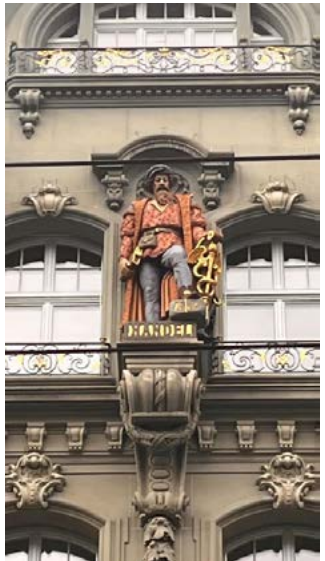
Die Wilhelm Kaiser nachempfundene Figur eines Handelsmannes, ganz oben an der Fassade des Kaiserhauses, Markt-gass-seitig (Bildhauer Karl Joseph Leuch).