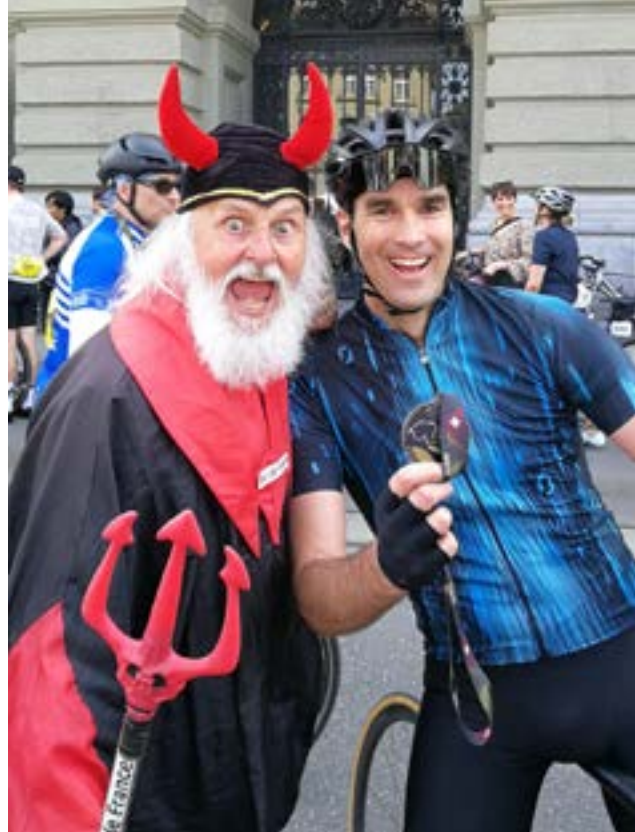
Vor drei Jahre nahm ich an der ETAPE DU TOUR DE FRANCE in Bern teil.