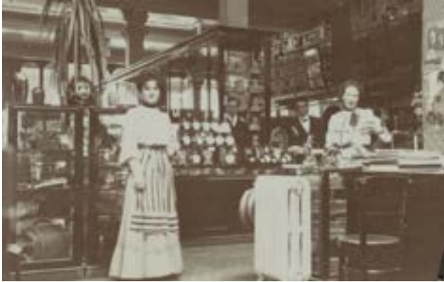
Die Warenpräsentation im alten Kaiserhaus orientierte sich am Stil amerikanischer Kaufhäuser.