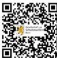
Whatsapp Gruppe für junge Schuhmacher/innen

Um auf dem Laufenden zu bleiben, kommst du am besten in die WhatsApp Gruppe für alle jungen Schuhmacherinnen und Schuhmachern zwischen 16 und 30 Jahren.