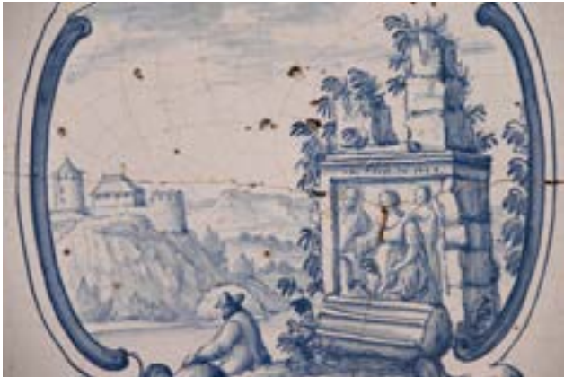
Nahaufnahme des Kachelofens.