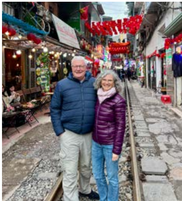
Reise durch Vietnam, Trainstreet Hanoi, Januar 2026.

Reisen, Neues zu entdecken, Fremdes kennenzulernen und mit Menschen in Beziehung zu treten, faszinieren mich, wie bereits erwähnt, schon mein gan-