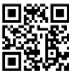
Anmeldung zu den JuBu Events