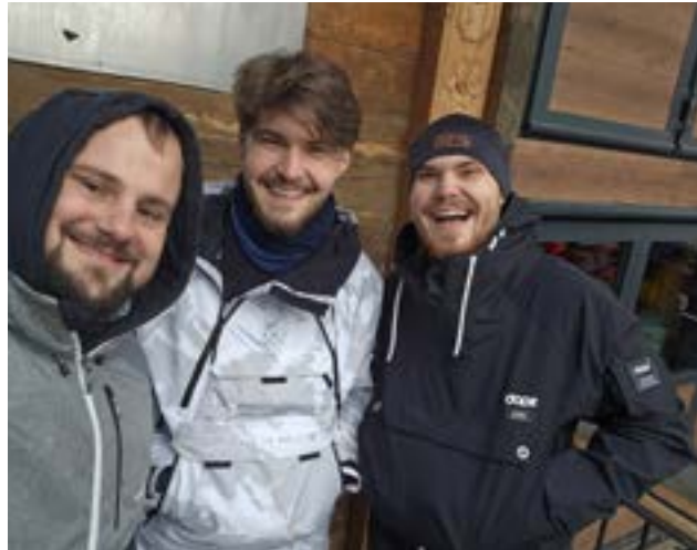
Beste Stimmung im legendären Hennu-Stall.

Das neue Gesicht: „Der Sonntag war dann die totale Entschädigung: Kaiserwetter und strahlender Sonnenschein. Bevor es zum Mittagessen ging, wollten wir aber noch eine vermeintlich ‚neue‘ rote Piste ausprobieren, die auf unserem Plan verzeichnet war. Auf Höhe Grünsee schossen wir uns motiviert in den Hang – nur um im Vorbeifliegen erschrocken festzustellen, dass das Pisten-Schild rund, schwarz und mit der Nummer 25 versehen war. Trotz der Überraschung haben wir zwei ‚halbstarken‘ Snowboard-Touristen die Abfahrt souverän bewältigt.“